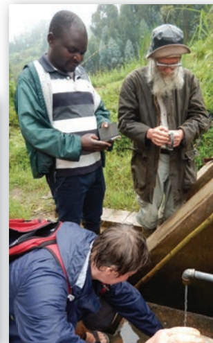
De bron Nyamaraba: opvang water via draineerbuizen – gelegen op 1945 m (Thommen) - matig debiet 0.5 l/sec - troebel water - drassige omgeving wat doet vermoeden dat draineerbuizen verstopt zijn en slechts een deel van het totale debiet van de bron opvangen.

De nood aan water is dan ook enorm. Alleen al aan drinkwater heeft het ziekenhuis meer dan 50.000 liter/dag nodig. Geographic System Technology (GST), een gerenommeerde onderneming op gebied van watervoorziening, stelde in onze opdracht vast dat er wel 4 (vier!) bronnen nodig zijn om de actuele behoeften aan water te dekken.